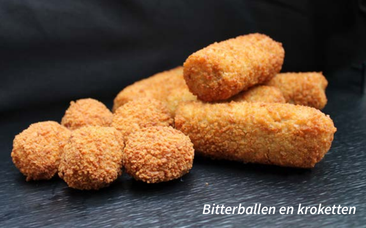
Bitterballen en kroketten